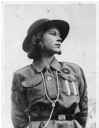
Prinsesse Elizabeth som Patruljeleder

Formålet med gradstegn på TimeWinder er at sætte patruljens leder og assistent i spil. Derfor er det vigtigt at bære jeres gradstegn, så I nemt kan identificeres af andre patruljer, stab og egne ledere.